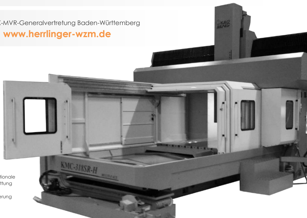
Abb. zeigt optionale Zusatzausstattung sowie Sonderlackierung